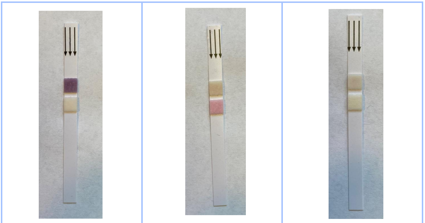
Figure 1. Echantillon positif leucocytes

Un échantillon positif leucocytes (fig.1), un échantillon positif nitrites (fig.2) et un échantillon négatif (fig.3) ont été testés.