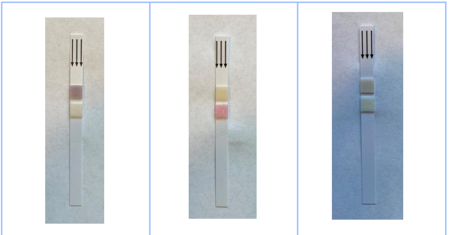
Figure 1. Echantillon positif leucocytes

Un échantillon positif leucocytes (fig.1), un échantillon positif nitrites (fig.2) et un échantillon négatif (fig.3) ont été testés.