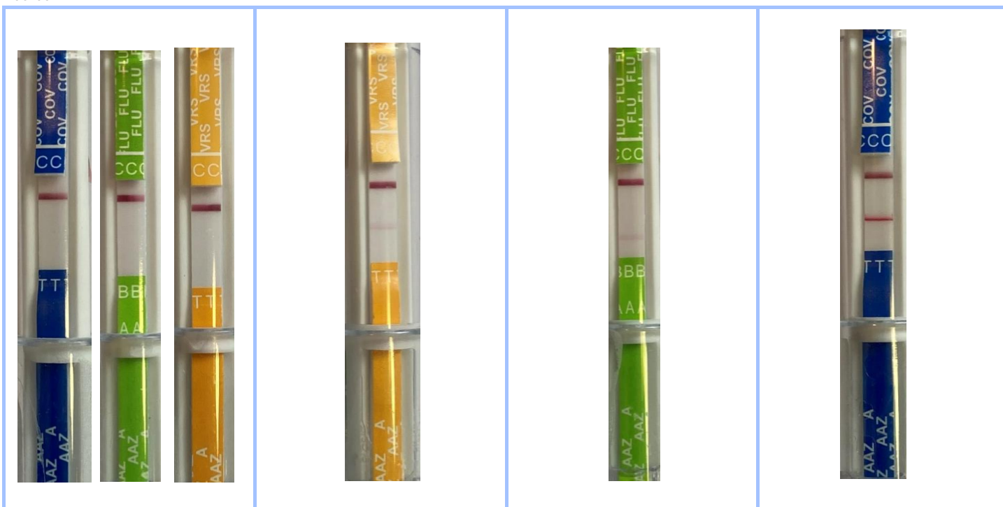
Figure 1. Echantillon négatif.

Un échantillon négatif (fig.1), un échantillon positif VRS (fig.2), un échantillon positif grippe (fig.3) et un échantillon positif COVID ont été testés.