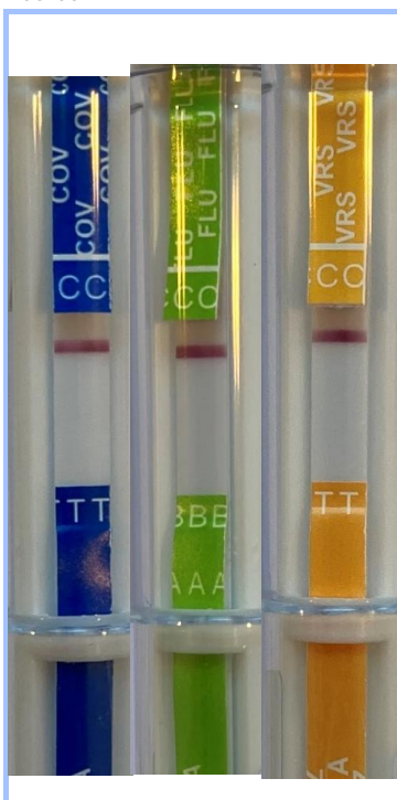
Figure 1. Echantillon négatif.

Un échantillon négatif (fig.1), un échantillon positif VRS (fig.2), un échantillon positif grippe (fig.3) et un échantillon positif COVID ont été testés.