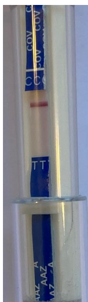
Figure 1. Echantillon négatif.

Un échantillon négatif (fig.1) et un échantillon positif COVID (fig.2) ont été testés.