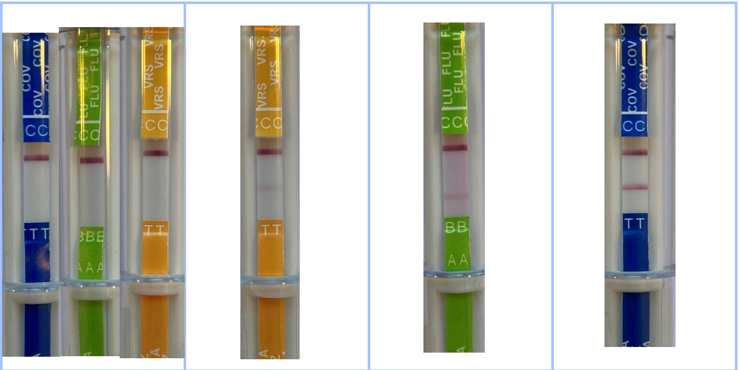
Figure 1. Echantillon négatif.

Un échantillon négatif (fig.1), un échantillon positif VRS (fig.2), un échantillon positif grippe (fig.3) et un échantillon positif COVID ont été testés.