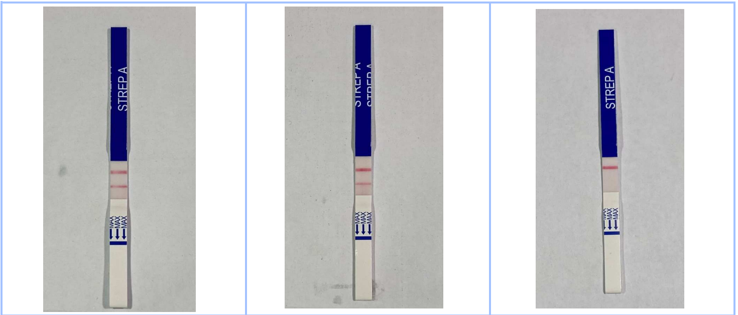
Figure 1. Echantillon positif fort.

Un échantillon positif fort (fig.1), un échantillon positif faible (fig.2) et un échantillon négatif (fig.3) ont été testés.