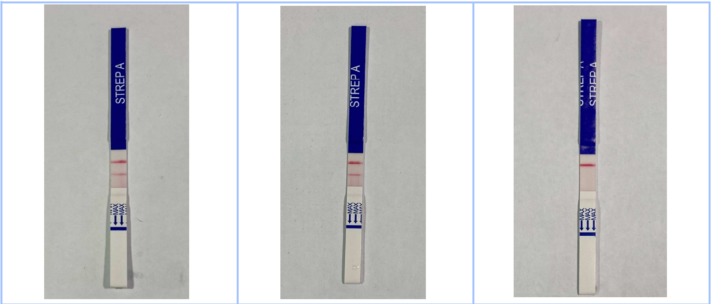
Figure 1. Echantillon positif fort.

Un échantillon positif fort (fig.1), un échantillon positif faible (fig.2) et un échantillon négatif (fig.3) ont été testés.